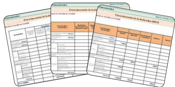
Imprimez vos états préparatoires des liasses fiscales 2054/2055/2033